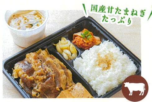
厳選牛すきしゃぶ弁当