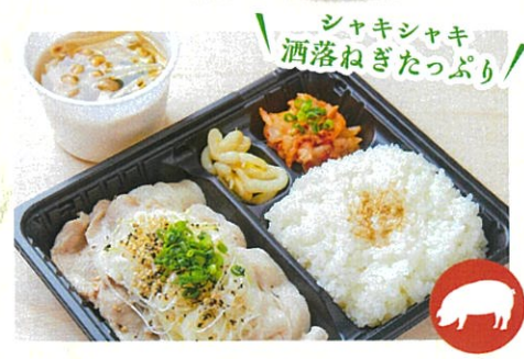
ねぎ塩豚ロース弁当