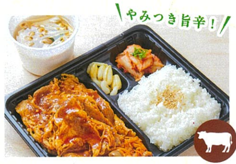
厳選牛カルビのプルコギ弁当